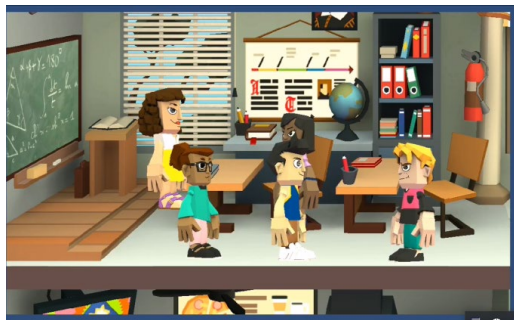
Figura 1. Aplicația Toontastic 3 D – Oracolul de Mircea Cărtărescu