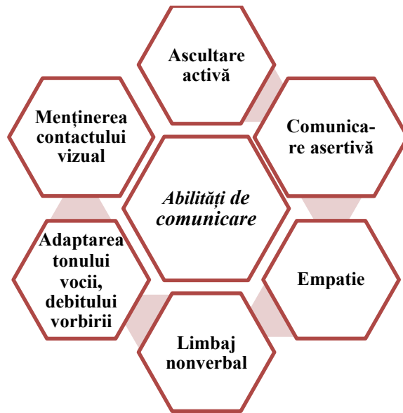
Figura 1. Spectrul abilităților de comunicare ale persoanei

Abilitățile bune de comunicare, de multe ori sunt un panaceu, pentru succesul personal și profesional al persoanei. De aceea, formării și dezvoltării acestora li se atribuie un rol important în actul educațional.